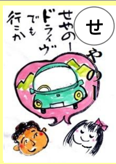
せやのー、ドライブでも行こか。 そうやのう、ドライブにでも行こうか。