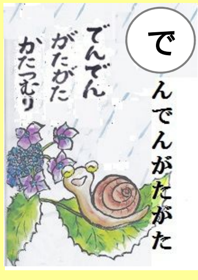
でんでんがたがた かたつむり… でんでんむしむし かたつむり…