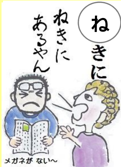
ねきにあるやん。 そば(ちかく) 側(近く)にあるやないの。