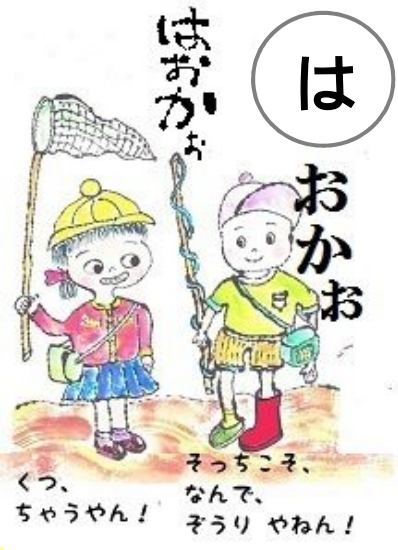
はおかあ。 アホかいな。