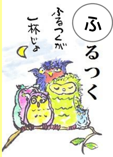
ふるつくが一杯じよ。 いっばい 梟(ふくろう)が一杯だよ。