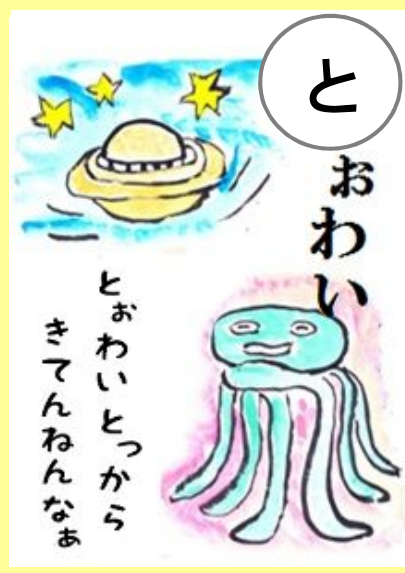
とおおいとっからきてんねんなあ。 とお ところ き 遠い所から来てるんですね。