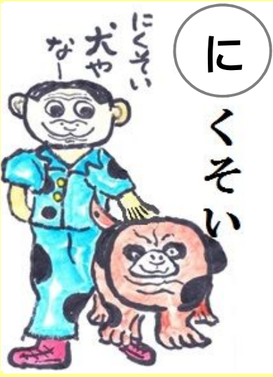
にくそい犬やなー ぶさいくな犬やなー