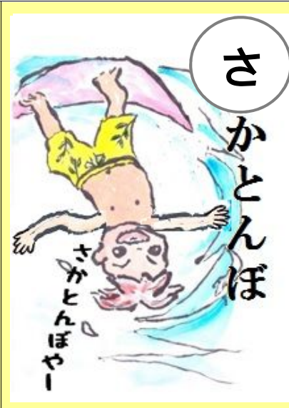
さかとんぼやー さかさまやー