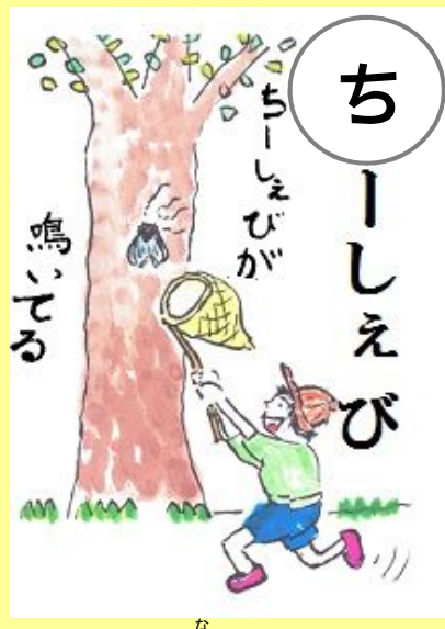
ちーしえびが鳴いている。 な ぜみ みんな蝉が鳴いている。