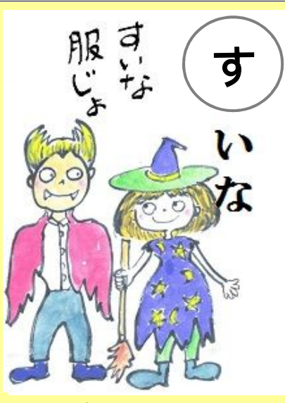
すいな服じよ。 へん ぶく 変な服だわ。