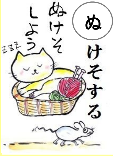
ぬけそしよう。 ぬ だ そーっと抜け出すことにしよう。