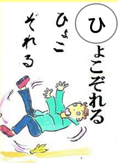
ひよこぞれるー ひっくりかえるー