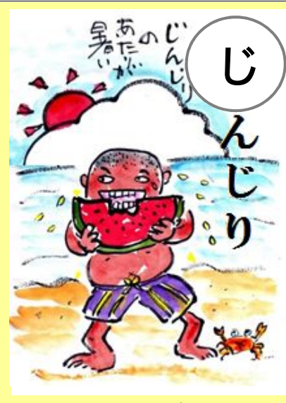
じんじりのあたりが暑い。 あたま 頭のつむじのあたりが暑い。