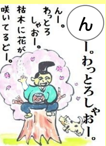
ん~。わつとろしやお~。 枯木(かれき)に花(はな)が咲(さ)いてるど~。 ん~。びっくりしたな~。 枯木に花が咲いてるで~。