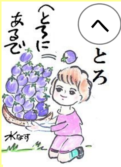
へとろにあるでえ。 たくさん 沢山あるよ。