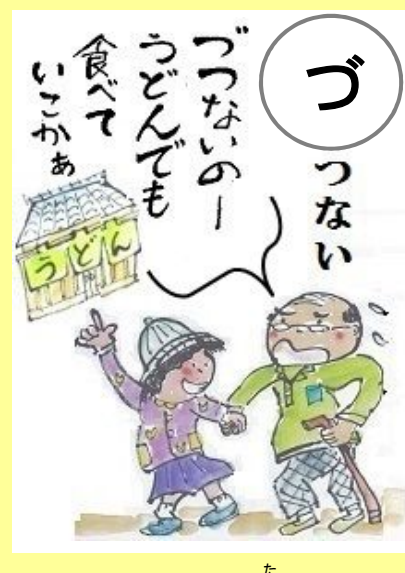
づつないのー、うどんでも食べていこかあ。 た しんどいなー、うどんでも食べていこか。