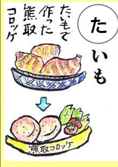
たいもで作った熊取コロッケ。 さといも つく くまとり 里芋で作った熊取コロッケ。