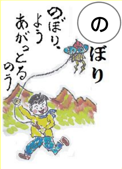
のぼり、ようあがってるのう。 たこ 風がよくあがっているなあ。