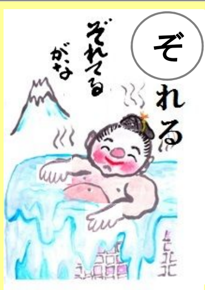
ぞれるがな(どれてるがな)。 あふれているやないの。