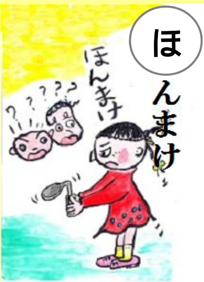
ほんまけー ほんとう 本当(ですか)？