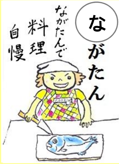
ながたんで料理自慢。 ほうちよう 包丁で料理自慢。