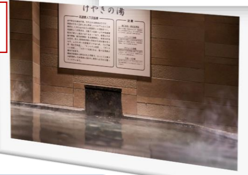
高濃度人工炭酸泉 けやきの湯