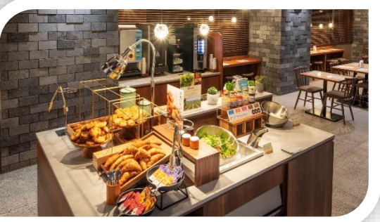
焼き立てパン 健康朝食

昨年2月にグランドオープンした、熊取町唯一のホテル。熊取駅より徒歩約2分と好立地で、泉州地区の観光客や関空への前泊に利用される方にも大人気です。男女別の人工炭酸泉「けやきの湯」は1日の疲れを癒してくれます。朝食は、焼き立てのパン健康朝食(無料)で、くまとりやもん♪にも認定されています。「熊取カレー」も人気。帰省されたご家族の宿泊にも最適です。