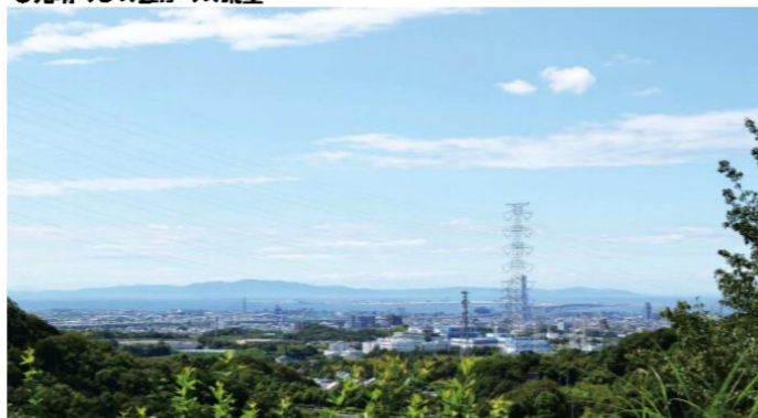
関西・淡路島・明石海峡大橋が一望できます。また、双眼鏡を使えば、神戸空港や神戸ポートタワーも見ることができます。

また、隣接した永楽ダムは見出川の上流に灌漑用、上下水道を確保するために昭和43年に完成した重力式コンクリートダムですが、周囲は約2kmのトリムコースが整備されていて「大坂みどりの百選」や「水源の森百選」に選定された緑豊かな自然と桜の名所。