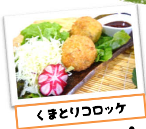
くまとりコロッケ

これからの取り組みとしては、 『永楽ゆめの森公園を生かして何かできないかなア』 『熊取発の新しいグルメを考えよう』 『熊取の土産もんを作ろう』 です。