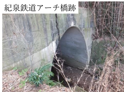
紀泉鉄道アーチ橋跡

貝塚市『すいてつ沿線魅力はっしん委員会』と熊取町『くまとりにぎわい観光協会』が共催で、水間鉄道清見駅と和歌山県粉河を結ぶ予定だった「幻の紀泉鉄道跡」と千石堀城跡・高井城跡を巡ります。