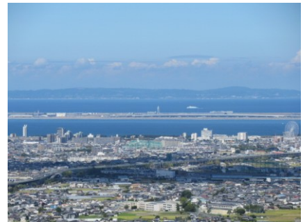
晴天時の雨山山頂より