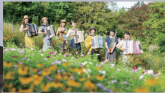
リュクスンブル公園 @luxembourg_park

アコーディオン、ノコギリ、ウクレレ、リコーダー、カホン、バケツベース、パーカッションの構成で、現在8人のメンバーで演奏している楽団「リュクスンブル公園」メロウでポップなオリジナル曲などを中心に、お子様から大人まで聞くと楽しく幸せな気持ちになれる演奏がワンダーフォレストに響き渡ります。アコーディオンの音の行進が聞こえたら行ってみよう音のなる方へ。