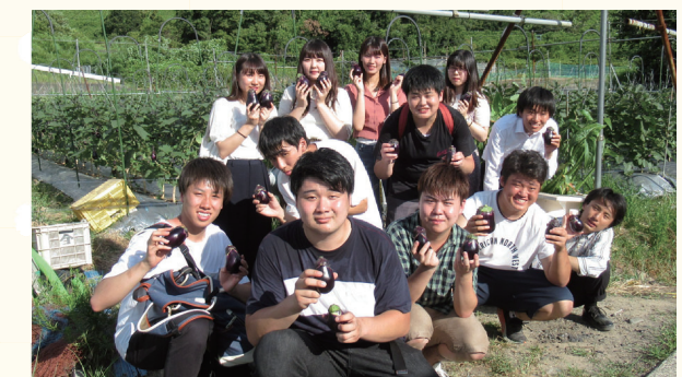
大阪観光大学RUSHプロジェクト & 共栄大学☆チーム内牧

『くまとりグルメマップ』(part2 こだわりランチ・飲食店編)では、(part1 スイーツ&ベーカリー編 に続き)観光を学ぶ東西両学生チームが町内を巡りました。安心・安全な食材、健康志向の調理方法、空間へのこだわり、そして個性あふれる店主の皆さん...。猛暑のなかでも楽しく調査・取材ができました。熊取グルメお楽しみください。ポナベティ!