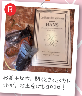
お菓子な本。開くとさくさくがっつり。お土産にもgood!