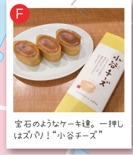
宝石のようなケーキ達。一押しはズバリ！“小谷チーズ”