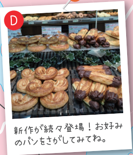
新作が続々登場！お好みのパンをさかしてみよう。