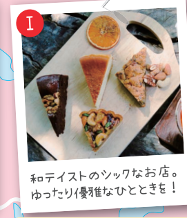
和テイストのシックなお店。ゆったり優雅なひとときも！