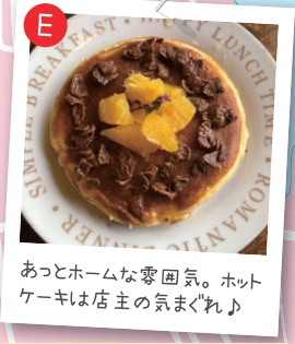
あっとホームな雰囲気。ホットケーキは店主の気まぐれ♪