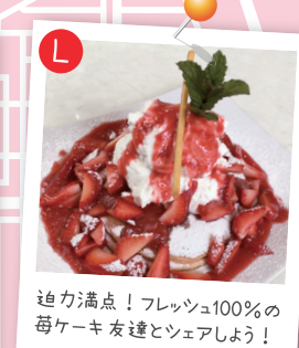
迫力満点！フレッシュ100%の毎ケーキ友達とシェアしよう！