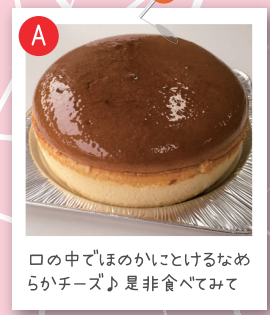
口の中でほのかにとけるなめらかチーズ♪是非食べてみて

Bee Smile(柴田養蜂場) 熊取町南山の手台 13-15 TEL : 072-453-6698 http://shibata-youhou.com