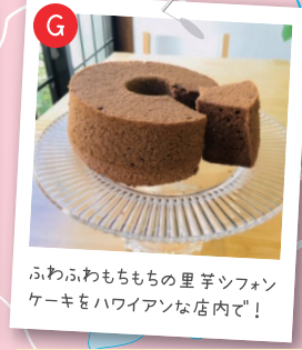
ふわふわもちもちの里芋シフォンケーキをハワイアンな店内で！