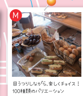
目つきしながら、楽しくチョイス！100種類のバリエーション