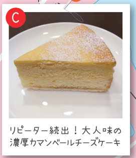
リピーター続出！大人味の濃厚カマンベールチーズケーキ