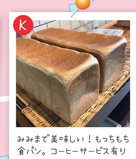
みみまで美味しい！もちもち食パン。コーヒーサービス有り