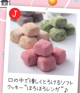
口の中で優しくとろけるソフトワッキー“ほろほろレング”♪