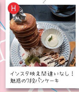
インスタ映え間違いなし！魅惑の7段パンケーキ