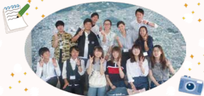
大阪觀光大學RUSH計劃&共榮大學學生義工

『熊取美食地圖』(part1 甜點&麵包編)以當地年輕人的獨特視角規劃、製作而成。調查也邀請了與當地關係密切的關東的大學生。來自不同地區的大學生走訪城市內的甜點店及麵包店,試食店鋪的推薦商品,並從與店主的對話中得知了商品和店鋪的詳細資訊。通過製作本地圖,學生深深體會到當地人的溫暖。請您拿著這張充滿熊取町魅力的地圖,走訪各家店鋪!