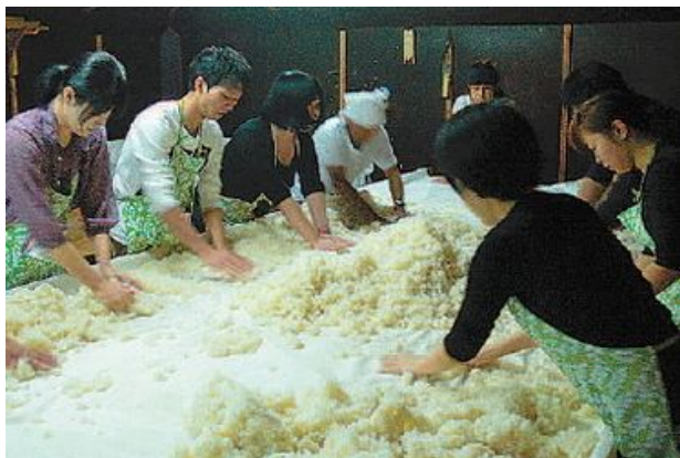
酒造りに欠かせない‘麴(こうじ)’をつくる