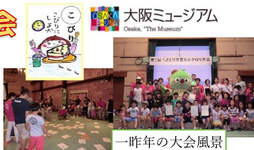
一昨年の大会風景