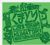
くまどりにぎわい観光協会について