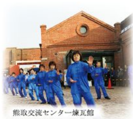
熊取交流センター煉瓦館