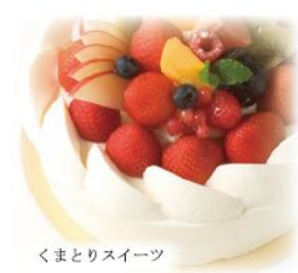
くまとりスイーツ