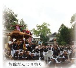
熊取だんじり祭り