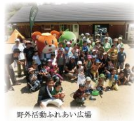
野外活動ふれあい広場