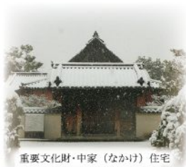
重要文化財・中家（なかげ）住宅